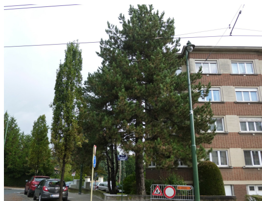
, 15 Octobre 2013