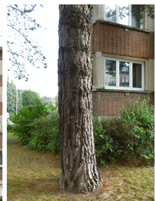
, 15 Octobre 2013