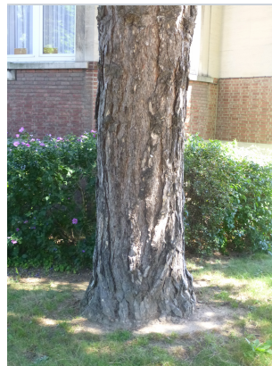
, 16 Août 2016

XLSX (Excel 2007) - XLS (Excel 1997-2003) .